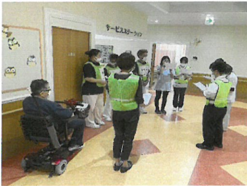
地震発生後、防災対策室の設置