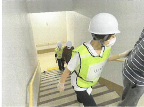
1Fより垂直避難誘導開始（入所者）