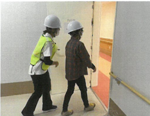
1Fより垂直避難誘導開始（デイケア）