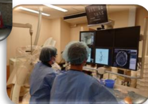
カテーテルを用いた 血管内手術