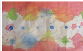
こんな感じに作品が出来上がりました