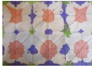
こんな感じに作品が出来上がりました