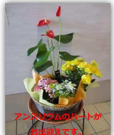
アンズリウムのハートが お出迎えです。