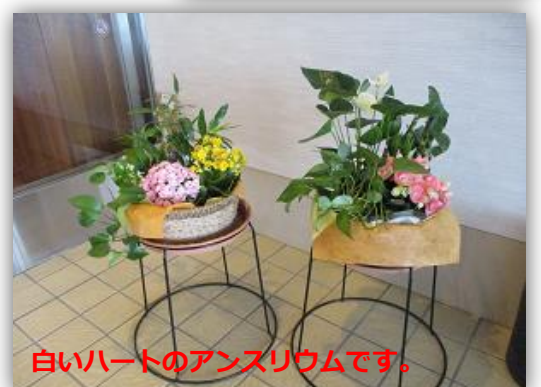
白いハートのアンズリウムです。