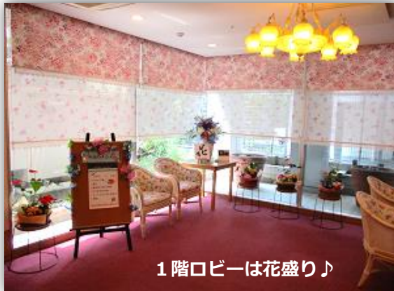
1階ロビーは花盛り♪