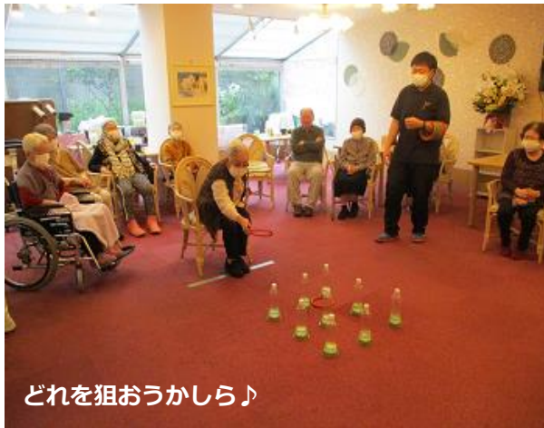
どれを狙おうかしら♪

このように楽しみながら(←ここ重要です)お身体を動かすレクリエーションを行っています。