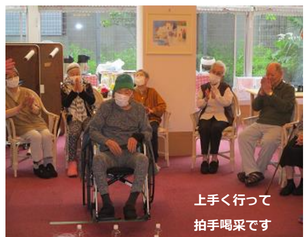
上手く行って 拍手喝采です