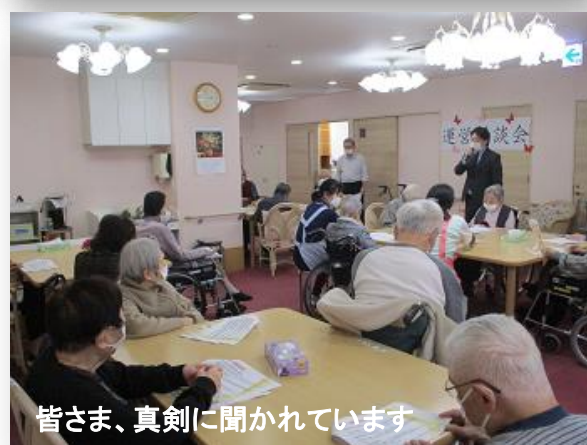
皆さま、真剣に聞かれています