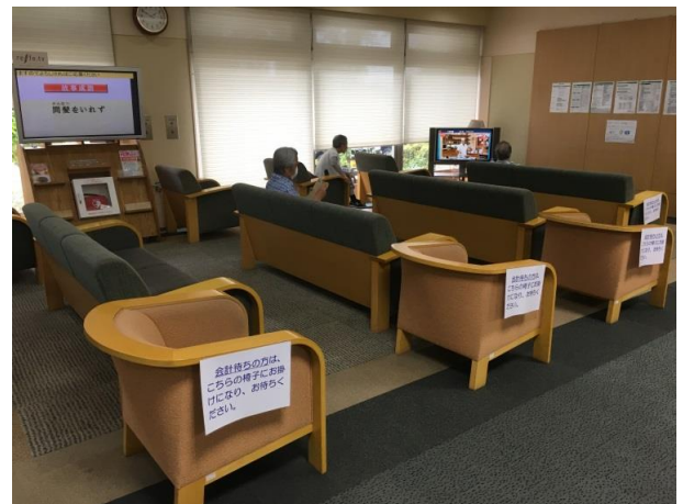
待合スペースを一方向へ変更