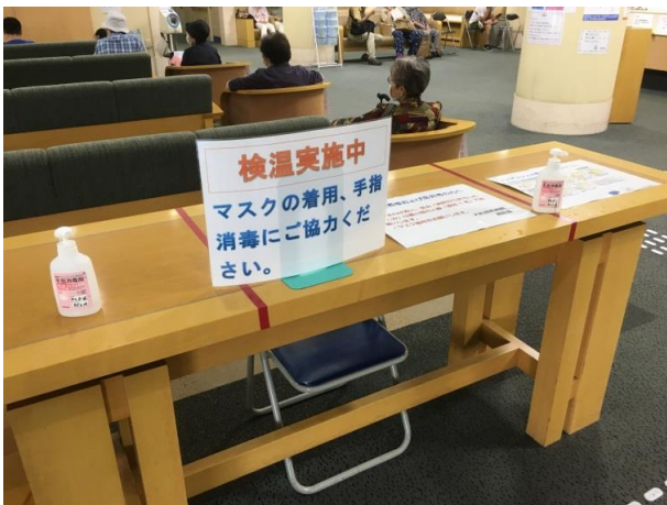
病院玄関での検温実施