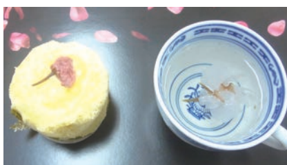
桜のカップケーキと桜茶