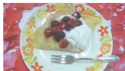
ベリーのクレープ