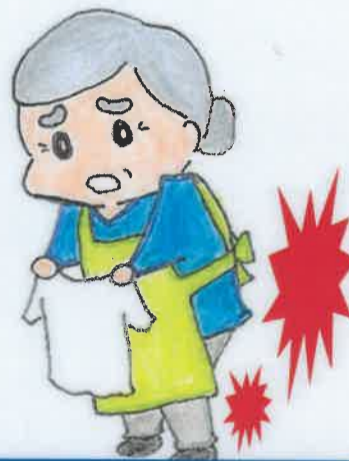
膝や腰が痛くて 家事が辛い