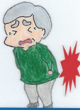
立ち上がり時 背中が痛い