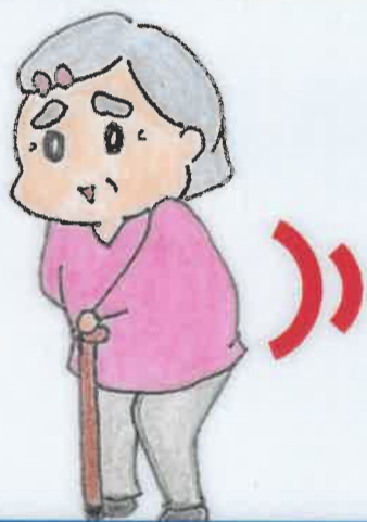
背中が丸くなった