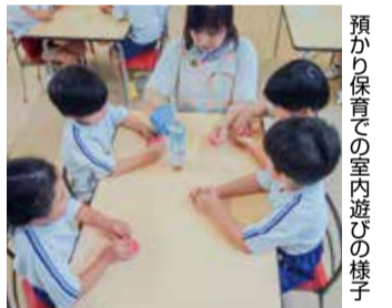
預かり保育での室内遊びの様子

「みどりスクール」は、横浜市戸塚区及び2の26の14認定こども園みどり幼稚園が利用できます。二カ月単位の定期預かり」と、その都度の利用となる