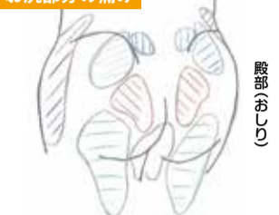
上・中殿皮神経、陰部神経の絞扼による痛みが出る部分

背骨の骨の間にある椎間板(クッション機能)が変形し、近くの神経を圧迫するように飛び出して、痛みやしびれを引き起こす疾患。