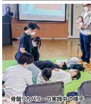
骨盤リカバリの実践中の様子

「同院スタッフ」当院では、妊娠・出産・産後という大事な期間を、お一人おひとりのご希望に寄り添いながら、医療チームでサポートしています。チームメンバーには医師