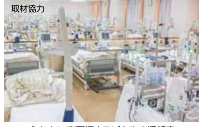
取材協力 ふれあい東戸塚ホスピタルの透析室

戸塚区上品濃にある「ふれあい東戸塚ホスピタル」では、人工透析治療を行なっています。病院スタッフのお話を紹介します。