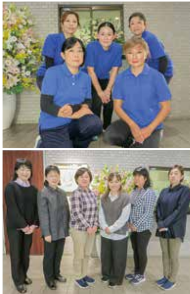
訪問介護部門(上)と居宅介護支援部門(下)の担当職員

「今回は、介護保険制度の中で当センターが算定している加算等と利用者さま・ご家族・地域等の関わりについてお話しさせていただきます。訪問介護は、特定事業所加算が算定されています。」