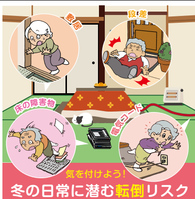
冬の日常に潜む転倒リスク

す。患者さまごとに、痛さや骨や関節などの体の組織に起こっている状態、生じている症状の重症度は異なりますので、お一人おひとりに適した治療方法を提案しています」