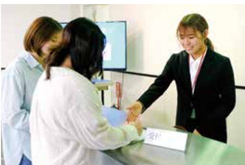
実習形式の授業もある

病院やクリニックには、医師や看護師だけでなく、来院者に適切な対応を行なっている事務系スタッフもいます。「医療事務」「医療秘書」はそれに該当し、患者と医師・看護師をつなぐ大事な役割を担います。多くの人は、「温かな笑顔で迎えてくれる受付の人」というイメージが大きいと思いますが、実は正確な会計やカルテの管理、予約の対応など、医療現場を円滑にまわすために欠かせない「縁の下の力持ち」的存在なのです。優しさが最大の力になる