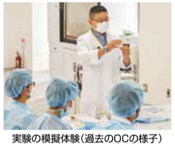
実験の模擬体験(過去のOCの様子)