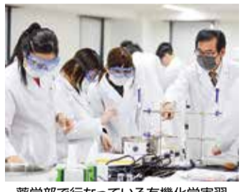
薬学部で行なっている有機化学実習

湘南医療大学入試事務室 045-821-0115 横浜市戸塚区上品濃16の48 東戸塚駅西口から徒歩15分