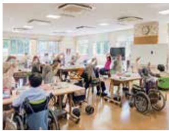
座ってできる体操を実施

地域病院「ふれあい鶴見ホスピタル」の通所リハビリテーションでは、セラピストによる専門リハビリを行っています。担当のセラピストにお話を聞きました。〈取材協力〉