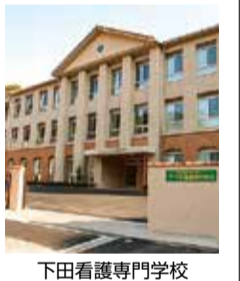
下田看護専門学校

同校の担当者は、次のように話しています。「本校では、「看護師になりたい」と強く願う人を全力で応援しています。看護の勉強は、つまずくこともありますが、寮から通う学生も多く、日々の生活が大変なこともあると思います。そのような姿もできる限りお支えしながら、皆さまの夢の実現のために尽力いたします。看護師という職業に興味がある方は、本校の説明会には是非一度、ご参加ください。」 湘南医療大学附属下田看護専門学校 0558-252211 静岡県下田市柿崎289