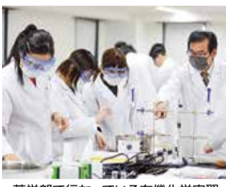
薬学部で行われている有機化学実習

今年度開催するオープンキャンパスでは、特に体験プログラムの模擬体験(過去のOCの様子)を