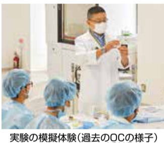
実験の模擬体験(過去のOCの様子)

昨年(2023年)実施の入試に関する情報や、来年の入学に向けた入試説明もありません。是非一度、ご参加を!