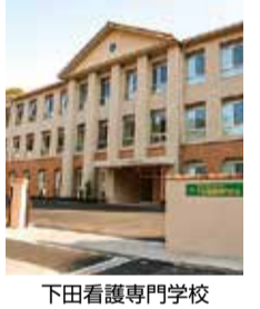
下田看護専門学校

同校は、神奈川県横浜市にある総合医療大学「湘南医療大学」の附属校であり、ふれあいグループに所属している