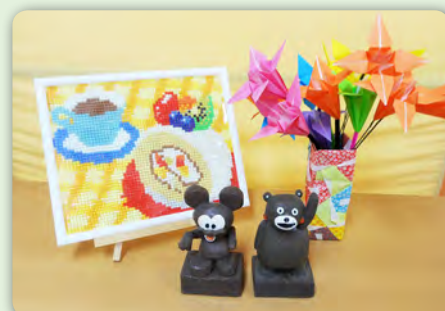
プログラムで作った作品です