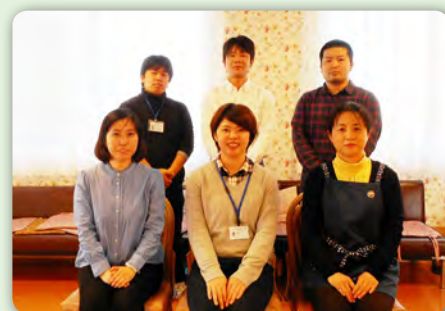
デイケアスタッフ

デイケアとは、精神科外来治療のひとつです。プログラム活動を通して、心と身体のリハビリテーションを行います。デイケアを利用する目的は「再発予防」「生活リズムを整える」「コミュニケーションの練習」「就労の準備」「外へ出るきっかけ作り」など人それぞれです。デイケアは同じ悩みや目的を持った方々と交流できる場所でもあります。また、スタッフも看護師、精神保健福祉士、作業療法士と各分野の専門職がおりますので病気のこと、生活のことなど気軽にご相談いただけます。見学や体験参加も出来ますので、興味のある方は当院デイケア担当スタッフへご連絡ください。