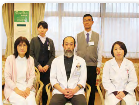
メンタルクリニックあゆみ橋職員