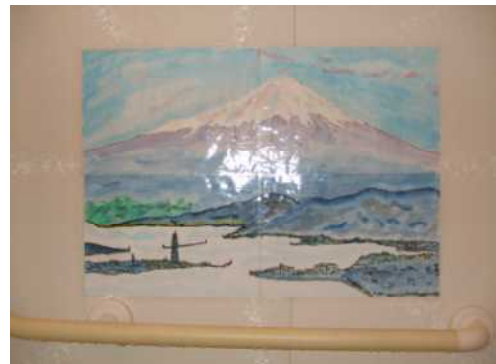
浴室の壁に富士山も…