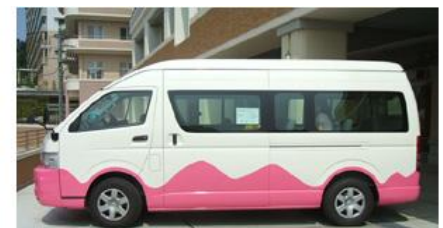
☆こちらのバスが循環しています