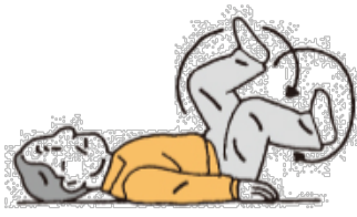
あおむけに寝て自転車をこぐ ように、両足をグルグル回す